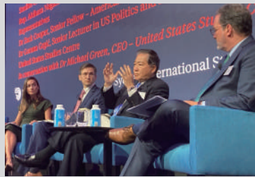
オーストラリアでは、日米豪専門家パネルに登壇