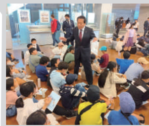
稲城市の小学生を国会見学にご招待