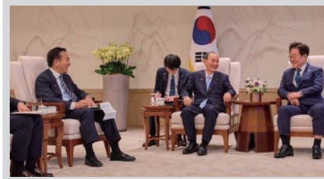
日韓議連・菅義偉会長と李在明大統領へ表敬