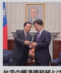
台湾の頼清徳総統とは20年来の親友