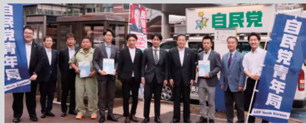
自民党多摩総支部青年部と拉致問題解決キャンペーン