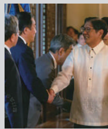
比マルコス大統領と会談