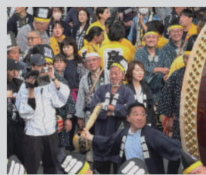
府中自慢の太太鼓に挑む