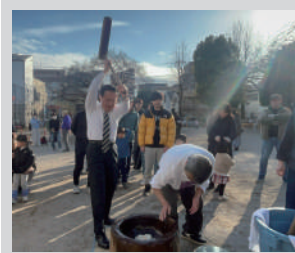
伝統のお餅つきは冬の風物詩