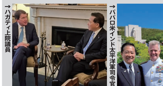
ハガティ上院議員