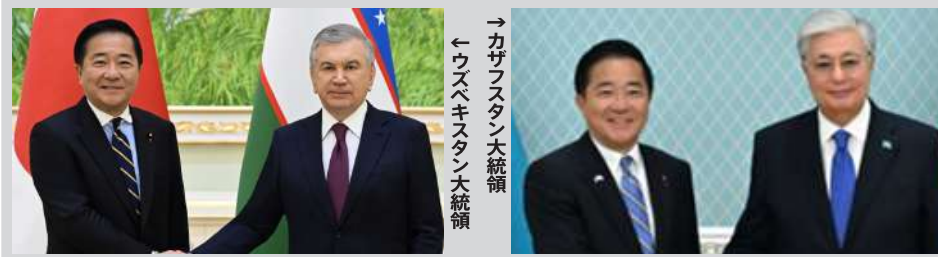
総理特使として中央アジア5カ国を歴訪し、レアアースなど重要な戦略資源を確保