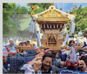
大國魂神社くらやみ祭で