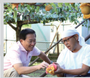
稲城市名物の梨は苦勞の結晶