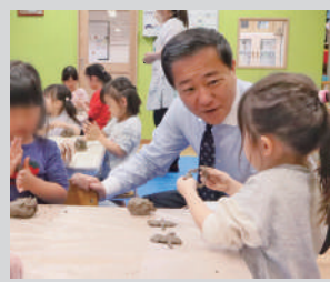
多摩市の未来を担うこどもファースト！